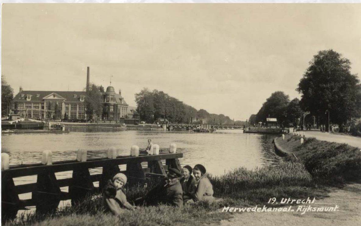
Gezicht op het Merwedekanaal met op de achtergrond de Muntbrug en de Rijksmunt. Prentbriefkaart naar foto omstreeks 1935. Afbeelding: Het Utrechts Archief. Bron: C.C.S. Wilmer, De getekende Stad.

Nu in het uitbreidingsplan van Welgelegen de woningbouw voortgaat en de bewoners voor het bezoeken van winkels voornamelijk zijn aangewezen op Oog in Al, achten B. en W. de tijd gekomen over te gaan tot het bouwen van een brug over de Leidscherijn ter verbinding van de Bartoklaan met de Mozartlaan. De kosten hiervan worden geraamd op 245.000 gulden. De aanwezigheid van 21 woonarken in het gedeelte tussen Hommelbrug en de te bouwen brug, hebben het ontwerp sterk beïnvloed. Het is namelijk niet verantwoord een vaste brug te maken omdat de woonarken dan geheel zouden worden ingesloten. De brug zal daarom worden voorzien van een uitvaarbare stalen middenoverspanning. (Utrechts Nieuwsblad 13 juli 1961).